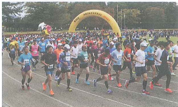
第36回大町アルプスマラソン大会の様子