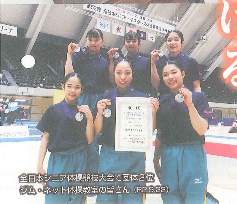
全日本シニア体操競技大会で団体2位 ジム・ネット体操教室の皆さん (R2.9.22)